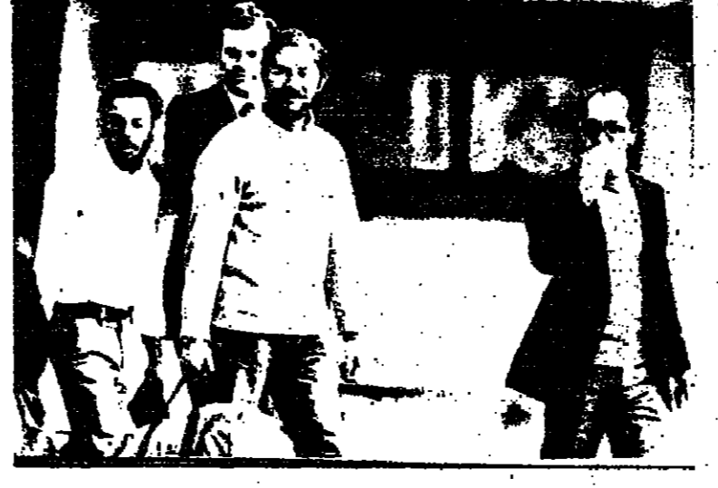
الثلاثة الذين تم اطلاق سراحهم من سفارة الدومنيكان في بوغوتا وقد بقي نحو ثلاثين من الدبلوماسيين الاحاب المحتجزين.

القلم - دعا وزير المعارف والثقافة السيد زيولون هامر جهاز التعليم الى العمل من اجل تحسين البيئة في البلاد وقال انه فلق من تدهور العلاقات الانسانية في المجتمع الإسرائيلي... بلدية الناصرة عيليت تقر ميزانيتها الاعتيادية